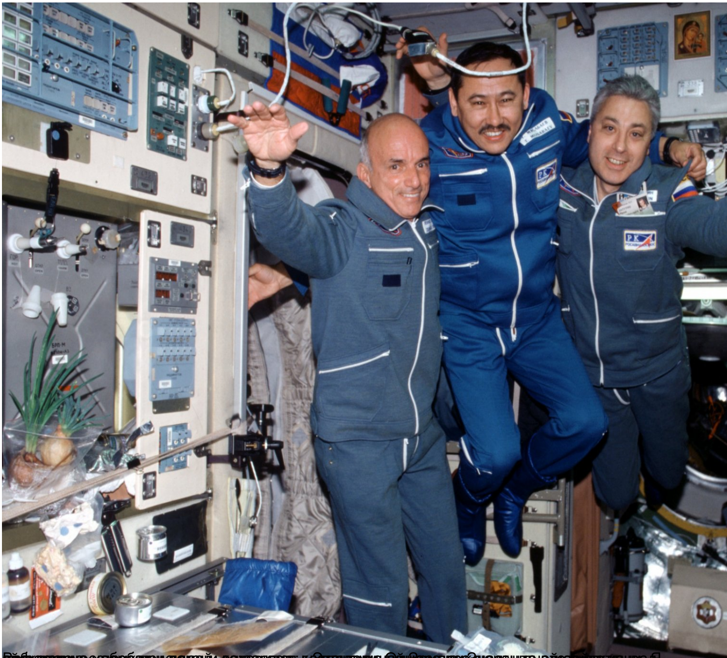
Вид изнутри станции с тремя космонавтами, к которым присоединился американец Скотт Велли в ходе его полета на МКС