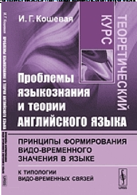
Кошечая И.Г. Проблемы языкознания и теории английского языка. Принципы формирования