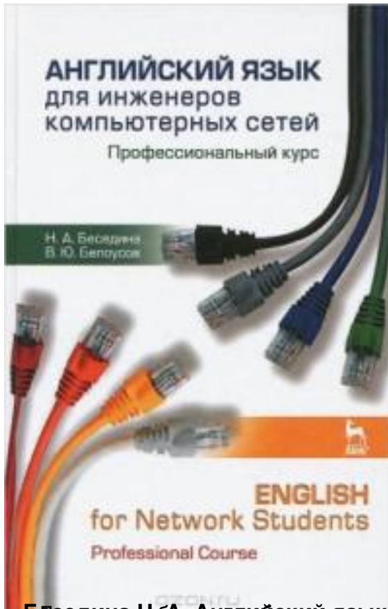
Беседина Н.А. Английский язык для инженеров компьютерных сетей. Профессиональный курс