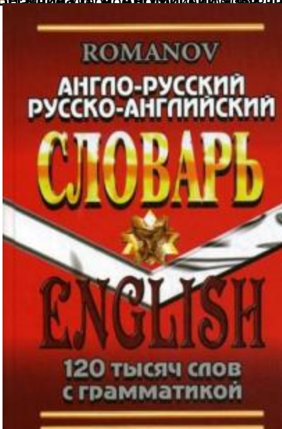
Романов Д.С. Универсальный русско-английский словарь 120000 слов / С. Романов