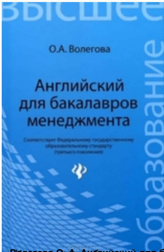
Волегова О.А. Английский для бакалавров менеджмента учебник для вузов / О.А. Волегова